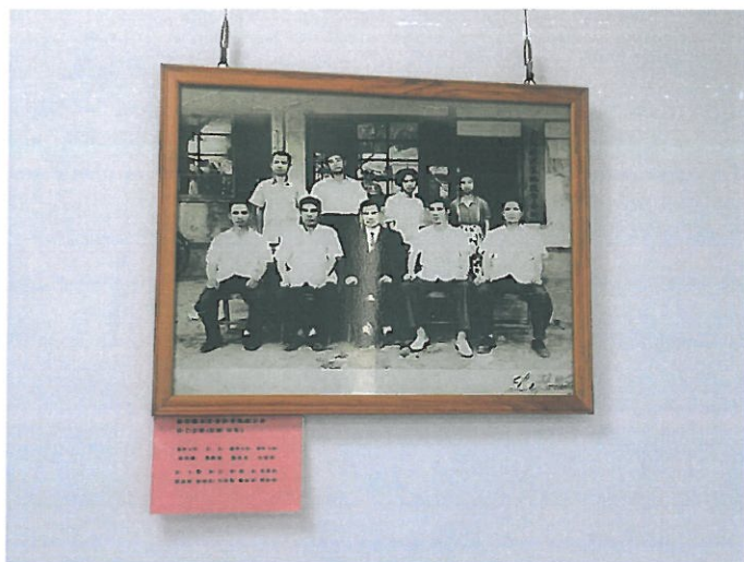
水里地政事務所 50 年代剛成立的老照片