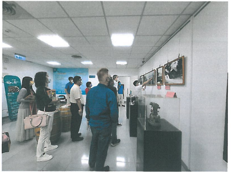
水里地政事務所同仁認真的為我們導覽解說