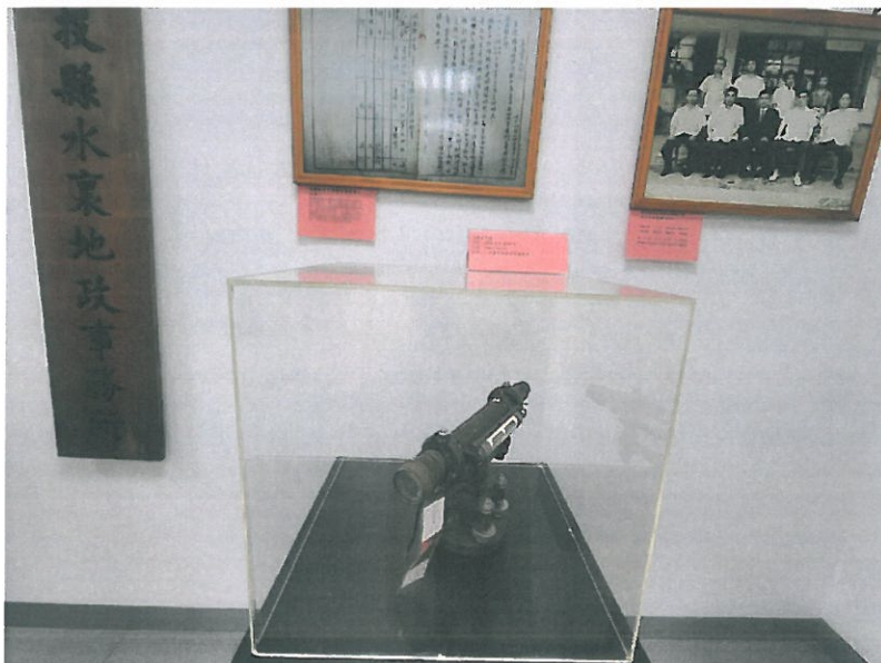
民國元年土地測量 儀器